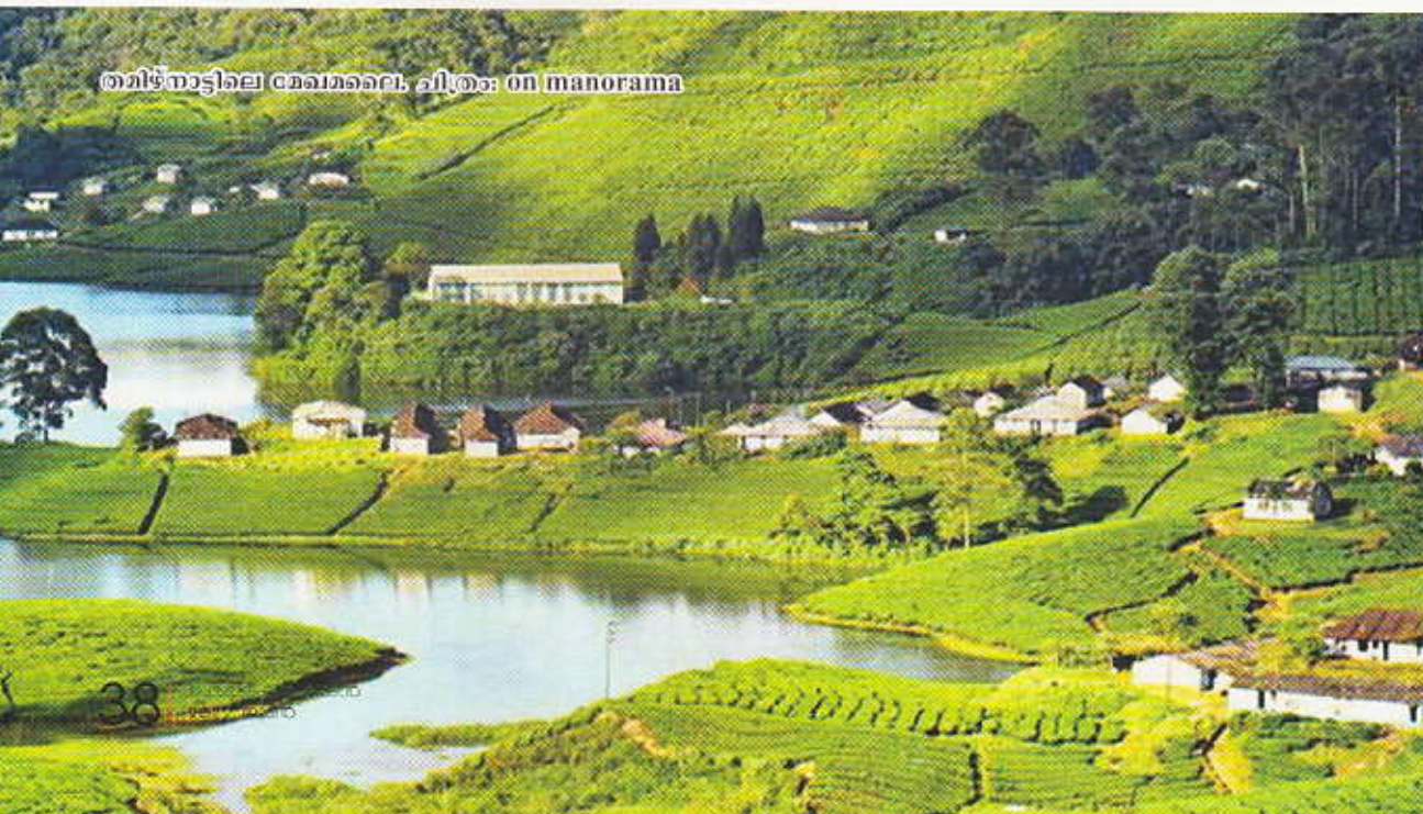
തമിഴ്നാട്ടിലെ മൊമൊറൈ