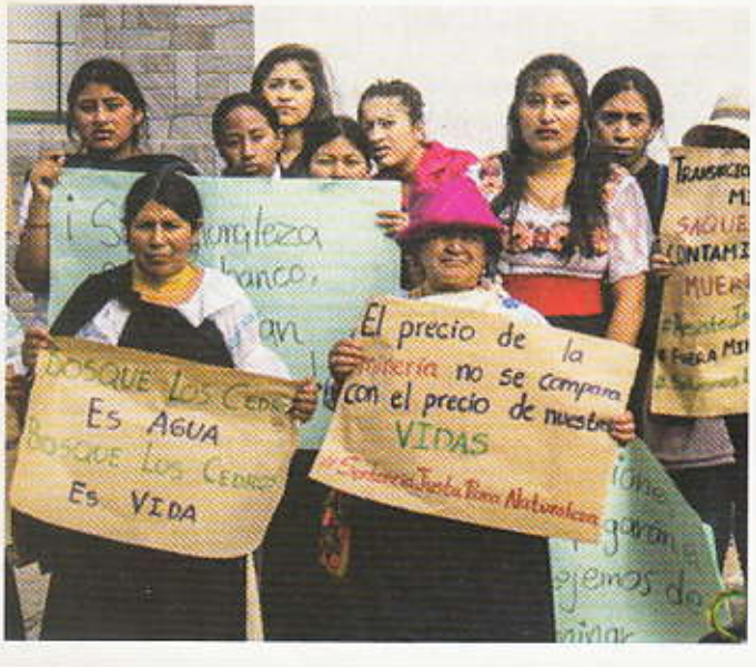
ഇകാഡോറിലെ ലൊ സെഗ്രോസിലെ ഖനനത്തിനെതിരെയുള്ള പ്രക്ഷോഭം.

സർക്കാർ അധീനതയിലുള്ള വനപ്രദേശത്തെ പുറമ്പോക്ക് വസ്തു, വ്യക്തികൾക്ക് പതിച്ചു നൽകി എന്ന കുറ്റമാരോപിക്കപ്പെട്ട്, അച്ചടക്ക നടപടികൾക്ക് വിധേയനായ തഹസീൽദാർ തലത്തിലുള്ള ഒരു മുൻ ഉദ്യോഗസ്ഥൻ നൽകിയ പരാതിയുടെ