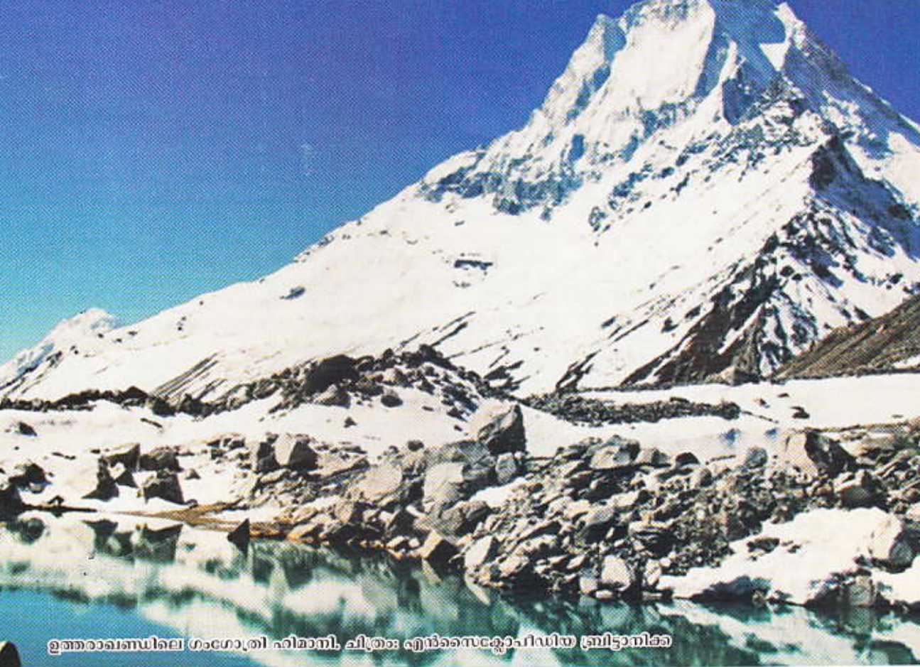
ഉത്തരാഖണ്ഡിലെ ഗംഗോത്രി ഹിമാനി, ചിത്രം: എൻസൈക്ലോപീഡിയ ട്രിപ്പാതിക്ക

പ്രായപൂർത്തിയാകാത്ത മക്കൾ, ശാരീരിക മാനസിക വൈകല്യങ്ങളുള്ള വ്യക്തികൾ എന്നിവർക്ക് അവരുടെ സുരക്ഷയുടെ കാവലാളായ രക്ഷകർത്താവ് മൂലം അവകാശങ്ങൾ നിഷേധിക്കപ്പെടുമ്പോൾ, ഒരു സംസ്ഥാന/രാജ്യത്തിന്റെ പരമാധികാരം ഉപയോഗിച്ച് മേൽപ്പറഞ്ഞ വ്യക്തിയുടെ രക്ഷകർത്വവും ഏറ്റെടുത്തുകൊണ്ട് ഭരണഘടന അനുശാസിക്കുന്ന നിയമപരമായ എല്ലാ സംരക്ഷണവും ഉറപ്പാക്കുന്നതാണ് പേരൻസ് പാട്രിയെയുടെ അധികാര പരിധി.